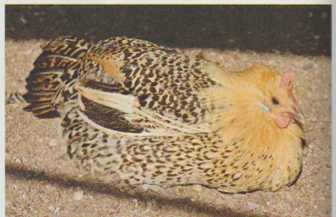
Die Groninger Möwen sind eine der vielen im Museum präsentierten niederländischen Heimatrasen