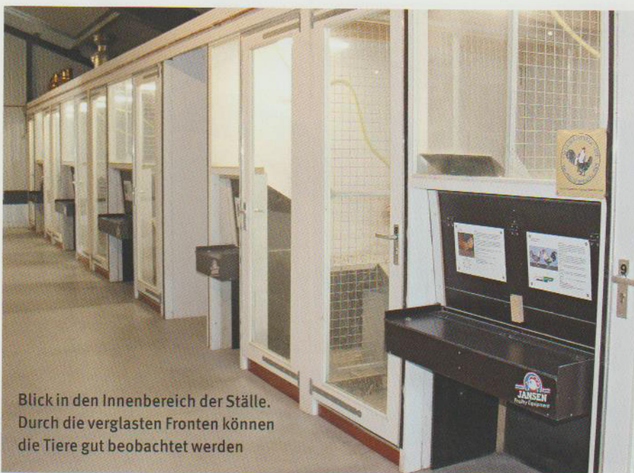
Blick in den Innenbereich der Ställe. Durch die verglasten Fronten können die Tiere gut beobachtet werden

Wirtschaftsfaktor – und ist es noch. Von hier aus werden die Preise für den Eierhandel bestimmt. Das niederländische Königspaar stattete aus diesem Grund im August der Gemeinde einen Besuch ab und lernte dabei auch das Barnevelder Huhn kennen, das Symbol für Ei und Huhn in dieser Region. In den Niederlanden werden jährlich über 10 Milliarden Konsumeier produziert, von denen 80 Prozent für den Export bestimmt sind. Grund genug, diesen Wirtschaftsfaktor durch Vogelgrippe ja nicht in Gefahr zu bringen, und Grund genug, dass 2023 Feldversuche mit einem Vaccine gegen die Vogelgrippe gestartet wurden. Übrigens: Der Eiermarkt ist längst zum Milliarden schweren Welthandel geworden. Der größte Eierproduzent innerhalb Europas ist – man staune – die Ukraine (2020). Der Weltproduzent Amerika wurde inzwischen von einem noch größeren Eierproduzenten überholt: China. Dabei geht es um die Produktion von Exporteiern und von Ei-Trockenprodukten. In Deutschland werden jährlich rund 13 Milliarden Konsumeier produziert. Das Barnevelder Huhn, das einst als Legerasse mit den bekannten braunen Eiern geschaffen wurde, ist in seiner Heimatstadt allgegenwärtig. Ob als