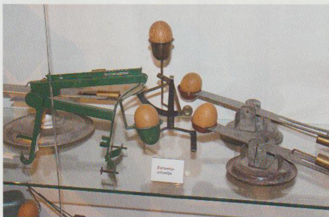
Unter der Exponaten ist auch eine Sammlung von historischen Eierwaagen zu sehen

Was gibt es in den Ausstellungsräumen zu sehen? Mit dem Museumsführer wird man über die Geschichte des Haushuhns informiert, sieht uralte Brutapparate bis zu riesigen Brutmaschinen (1940 bis 1970, als die Eierindustrie Fahrt aufnahm), und große Eiersortiermaschinen (von denen eine zur Demonstration noch in Betrieb ist).