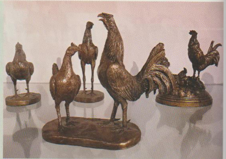
Zahlreiche Gemälde (wie die Holländer Weißhauben von Delin) und Figuren (im Bild verschiedene Kämpferrassen) aus unterschiedlichen Materialien bereichern die Ausstellungsräume

und Hühnerstämmen niederländischer Rassen.